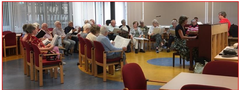
Gemengd koor Viva la Musica op de eerste repetitiedag in augustus 2023 in de nieuwe samenstelling

Het koor repeteert iedere maandagochtend van 9.30 tot 11.30 uur en verwelkomt graag nieuwe, enthousiaste leden!